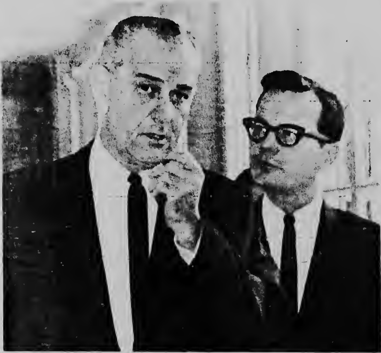
WASHINGTON--Presidente Johnson ta regresa su oficina despues di a tene un speech na television den cual el a pidi un reunion inmediato di e Consejo di Seguridad di Nacionnan Uni den un intento pa trese e guerra di Vietnam ne mesa di conferencia.

Aparentemente, Pravda ta censura tambe e intencionan di Kruschew pa ensalza su propio papel durante e guerra, especialmente den e batalla di stalingrado, pasando por alto esun di Stalin y esun di e hefenan militar di e tempunan di e guerra.